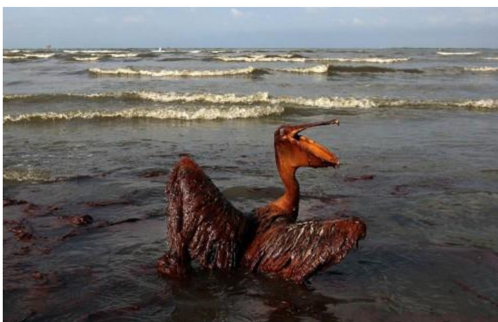
Рис. 4.2 Разные примеры нефтяного загрязнения океанов и морей